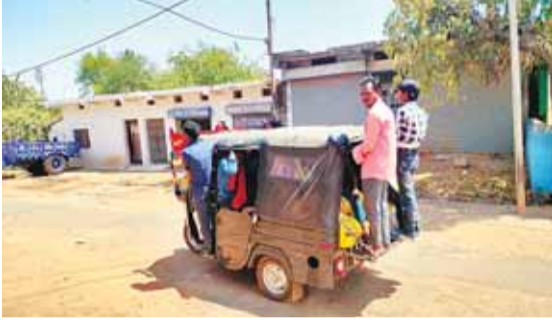
ओवरलोड सवारियां बैठाने के नजारे तो अब आम हो गए हैं।